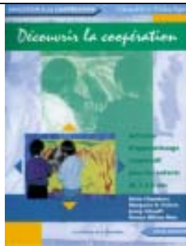
Collection Chenelière/Didactique .Editions Pirouette