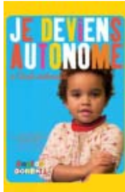
collection Dopido DOREMI, Editions Pirouette