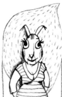
Das ist Frau Haselnuss, die Mama.