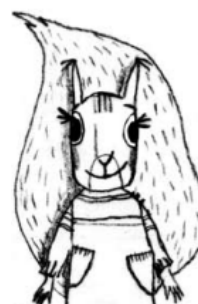
Das ist Hanna Haselnuss.