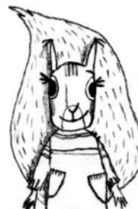
Das ist Hanna Haselnuss.