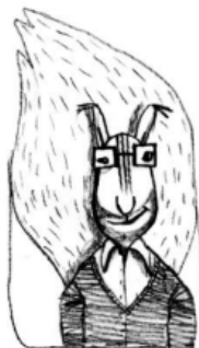
Das ist Herr Haselnuss, der Papa.