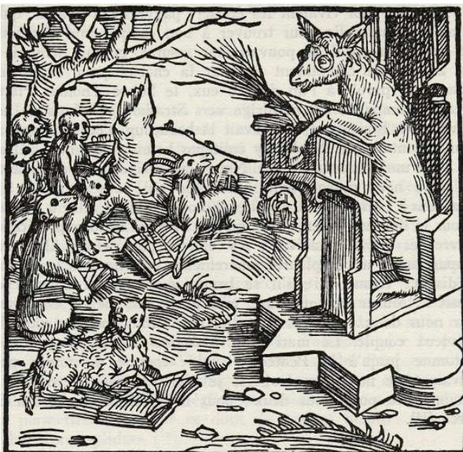
Ludimagister litterarum ignarus. OLEARIUS, De fide concubinarum , 1505.