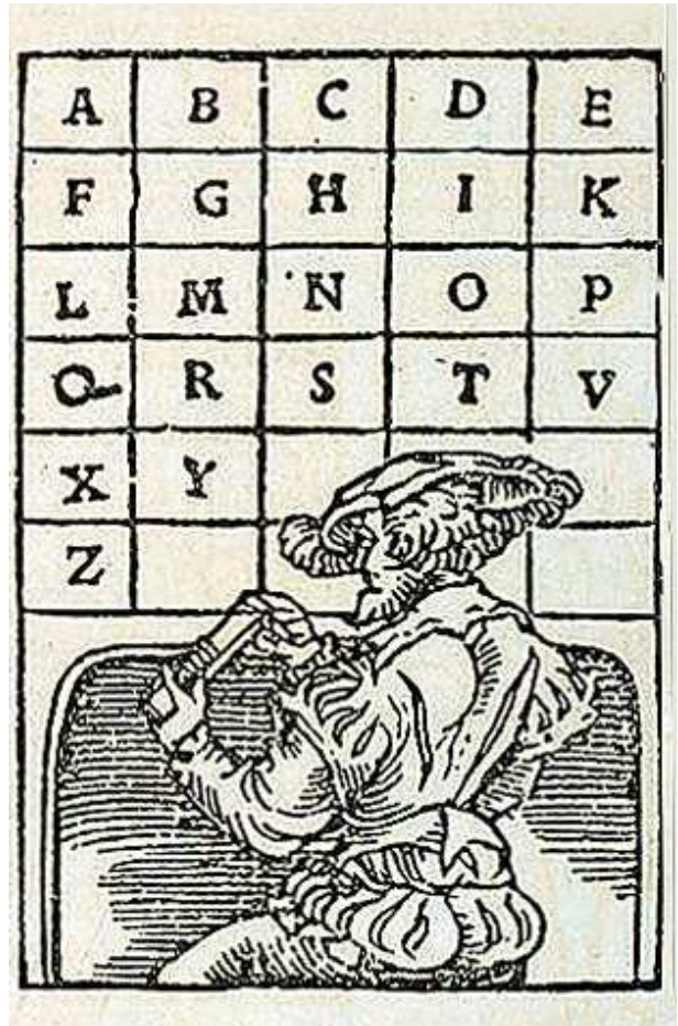
Illustration in Joannes Arnoldus Bergellanus, De chalcographiae inventione poema ecomiasticum . (Mainz :Mayence Franz Benem, 1541)