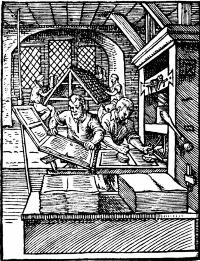
1568 Jost Amman